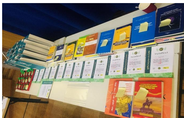
ХААИС-ийн Хатан туул театр. 2019.11.22.