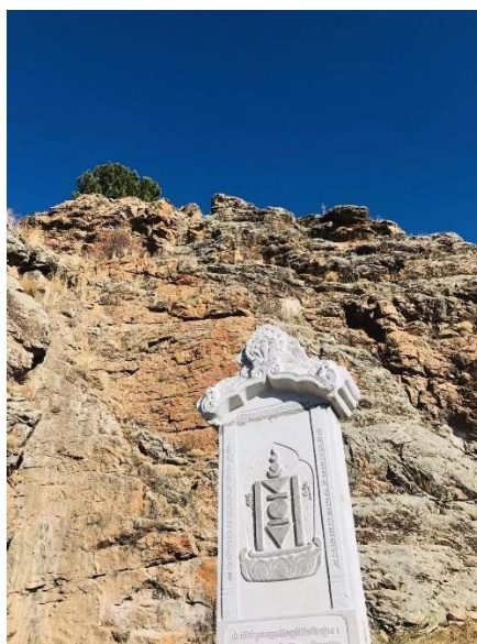
Өвөрхангай аймгийн Бат-Өлзий сумын Төвхөн хийдэд Соёмбо үсэгт зориулсан гэрэлт хөшөө-тааллын шүтээн. 2019.10.06