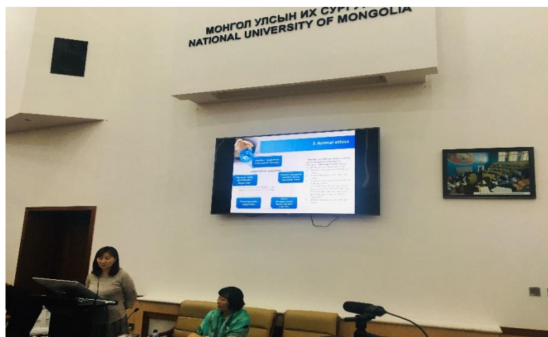
Тогтвортой хөгжил: Ногоон ёс зүй. ЭШБХ. 2019.11.19.