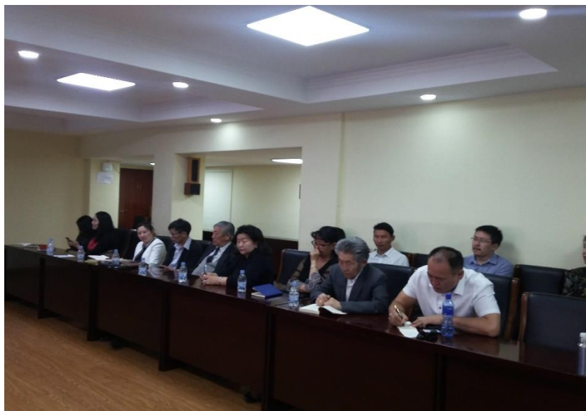
ШУА-ийн Тэргүүлэгчдийн газрын хурлын танхим. 2019.05.23.